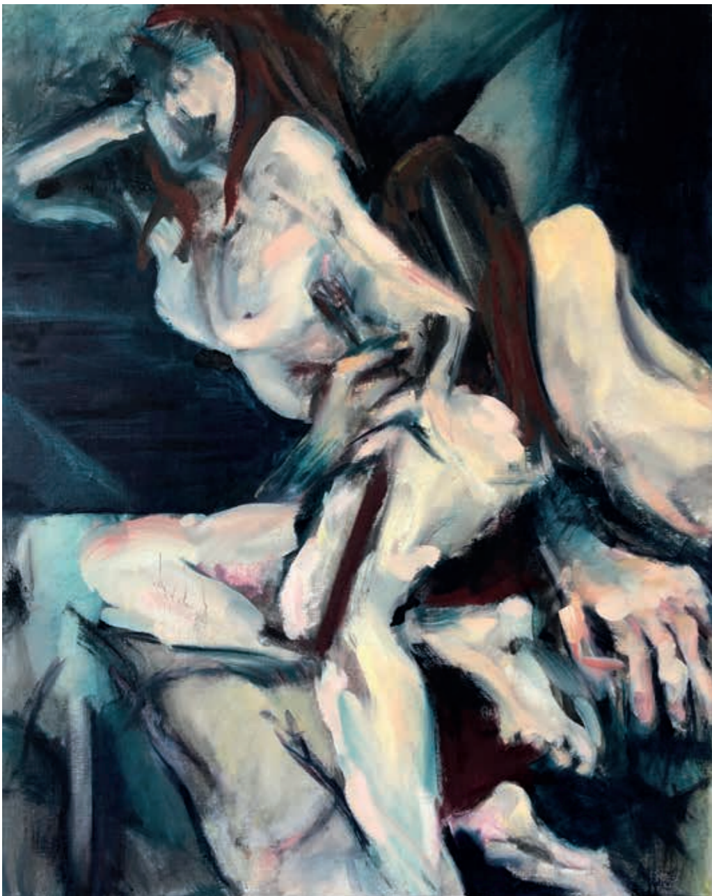
The Last Evening Before Silence. The Woman. , oil on canvas, 76x60 cm, 2020

The woman sits alone, no need to dress, we are not going anywhere, we are in lockdown, even the cats have disappeared. But he is there, too. Is it going to happen? Are we going to talk, or avoid each other like shadows?